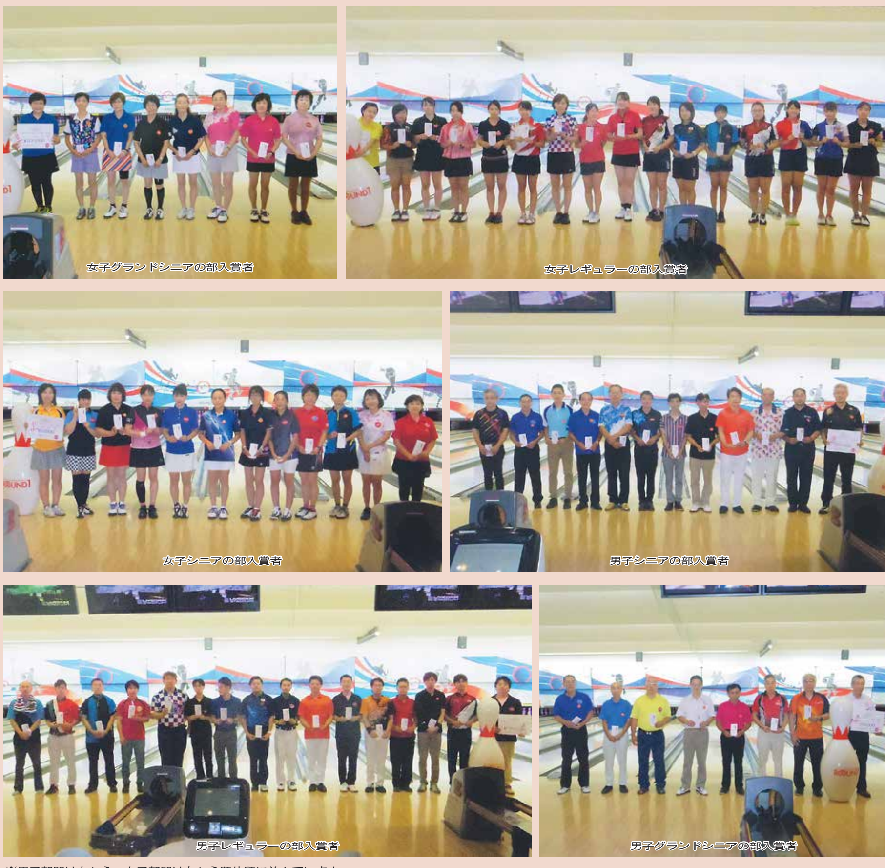
※男子部門は右から、女子部門は左から順位順に並んでいます