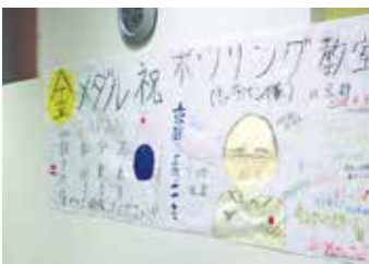
歓迎の似顔絵は「くじ」と大評判

1月26日(日) 津グランドボウル(三重県津市) 1月27日(月) 多治見パークレーンズ(岐阜県多治見市) 参加申込方法、受付期間等は協会ホームページ(www.jbc-bowling.or.jp)に発表します。