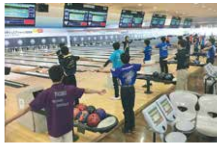
投球前にストレッチ