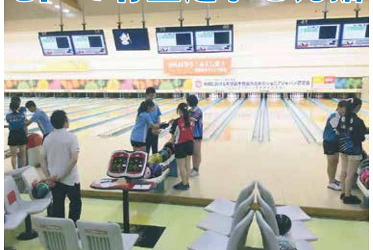
記録会に臨む選手たち

2018年度ジュニアジャパン強化選手認定会が、8月13日(月)から20日(月)にかけて福島・東京・大阪・福岡の4地区で行われました。各都道府県から推薦されたジュニア選手の中から選ばれた94名が参加しました。 各地区1泊2日の合宿形式で、記録会やトレーニングを行いました。選手たちの先輩にあたる全日本ナショナルチーム・ユースナショナルチームのOB・現役メンバーがサポートしました。