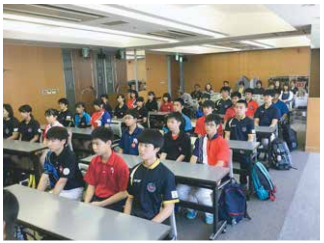
開講式では緊張感も

2018年度ジュニアジャパン強化選手認定会が、8月13日(月)から20日(月)にかけて福島・東京・大阪・福岡の4地区で行われました。各都道府県から推薦されたジュニア選手の中から選ばれた94名が参加しました。 各地区1泊2日の合宿形式で、記録会やトレーニングを行いました。選手たちの先輩にあたる全日本ナショナルチーム・ユースナショナルチームのOB・現役メンバーがサポートしました。